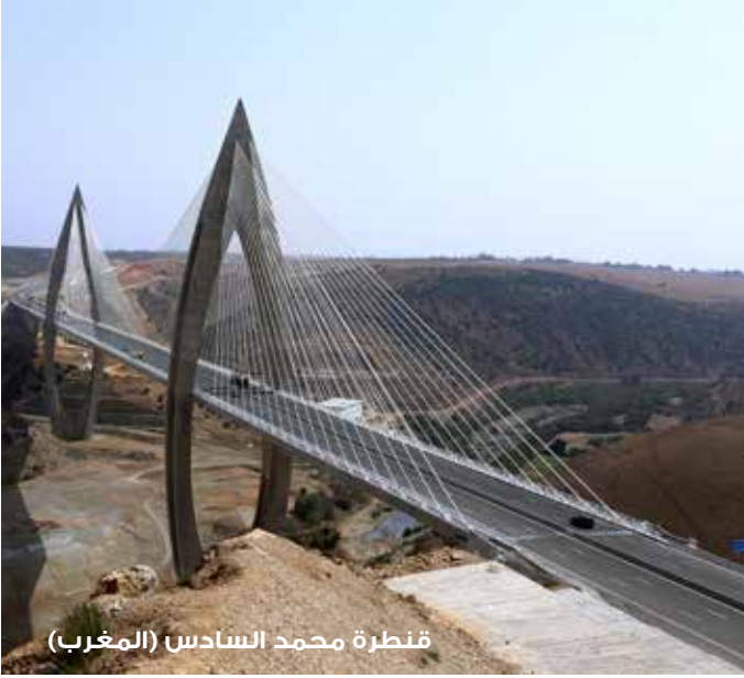
قنطرة محمد السادس (المغرب)

2003 : محمود أبو زيد، وزير الموارد المائية والري (مصر) وجرسون كلمان، رئيس مدير الوكالة الوطنية للماء (البرازيل)